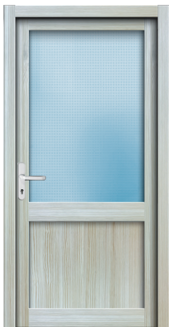
Nebeneingang NT 01