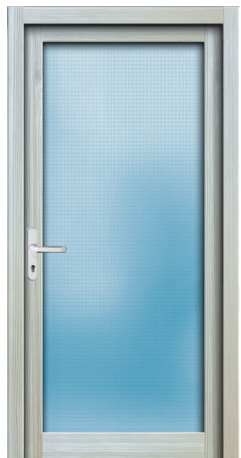
Nebeneingang NT 03