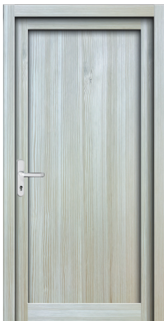
Nebeneingang NT 04