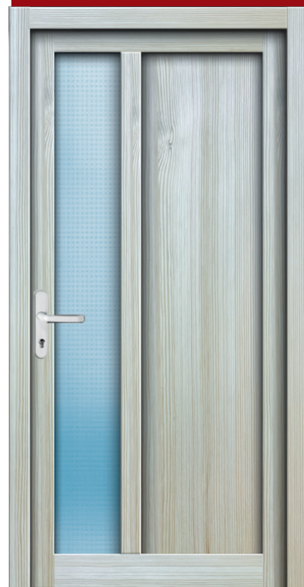
Nebeneingang NT 05