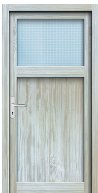
Nebeneingang NT 02