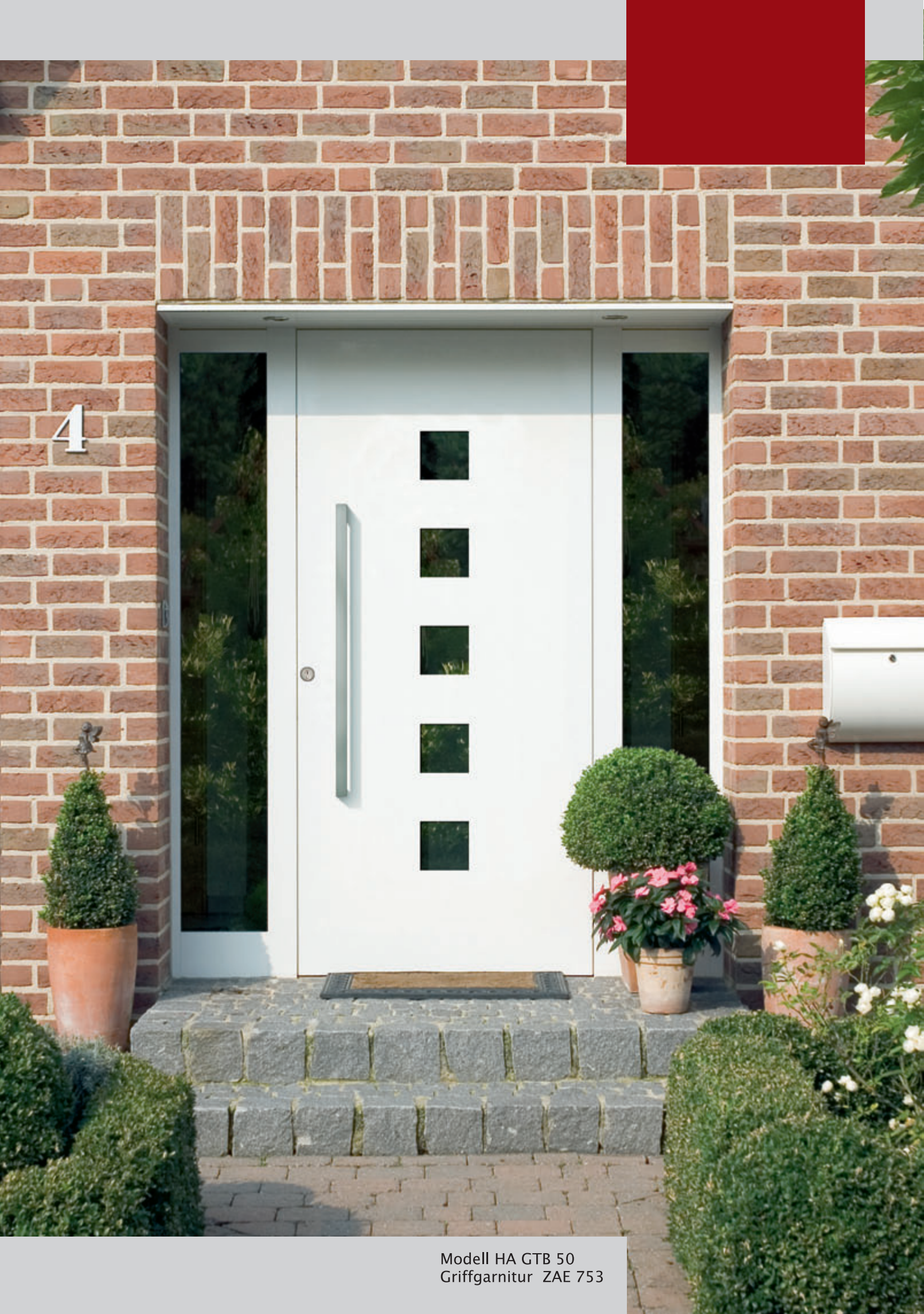
Modell HA GTB 50 Griffgarnitur ZAE 753