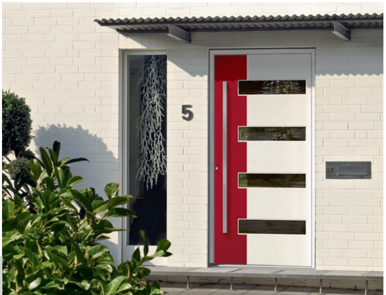
Modell HA GTB 80 Griffgarnitur ZAE 753