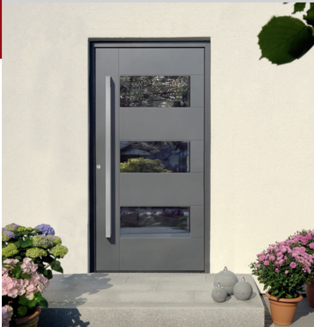
Modell HA GTB 60 Griffgarnitur ZAE 753