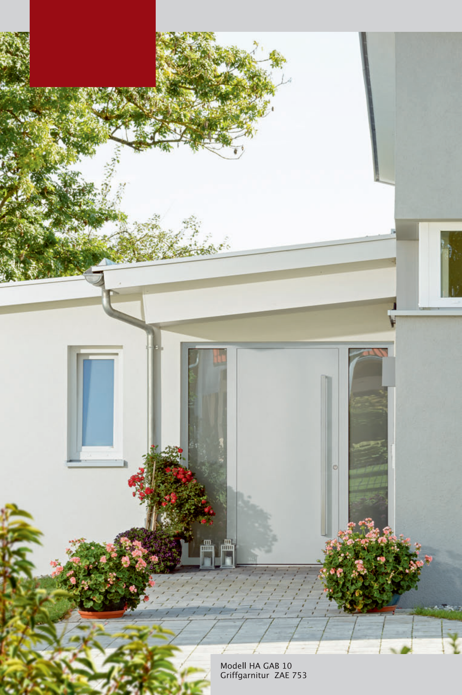
Modell HA GAB 10 Griffgarnitur ZAE 753