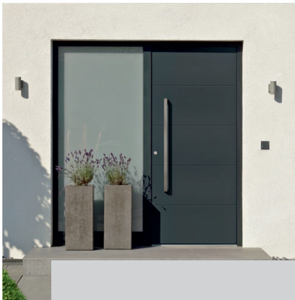
Modell HA GTB 10 Griffgarnitur ZAE 753