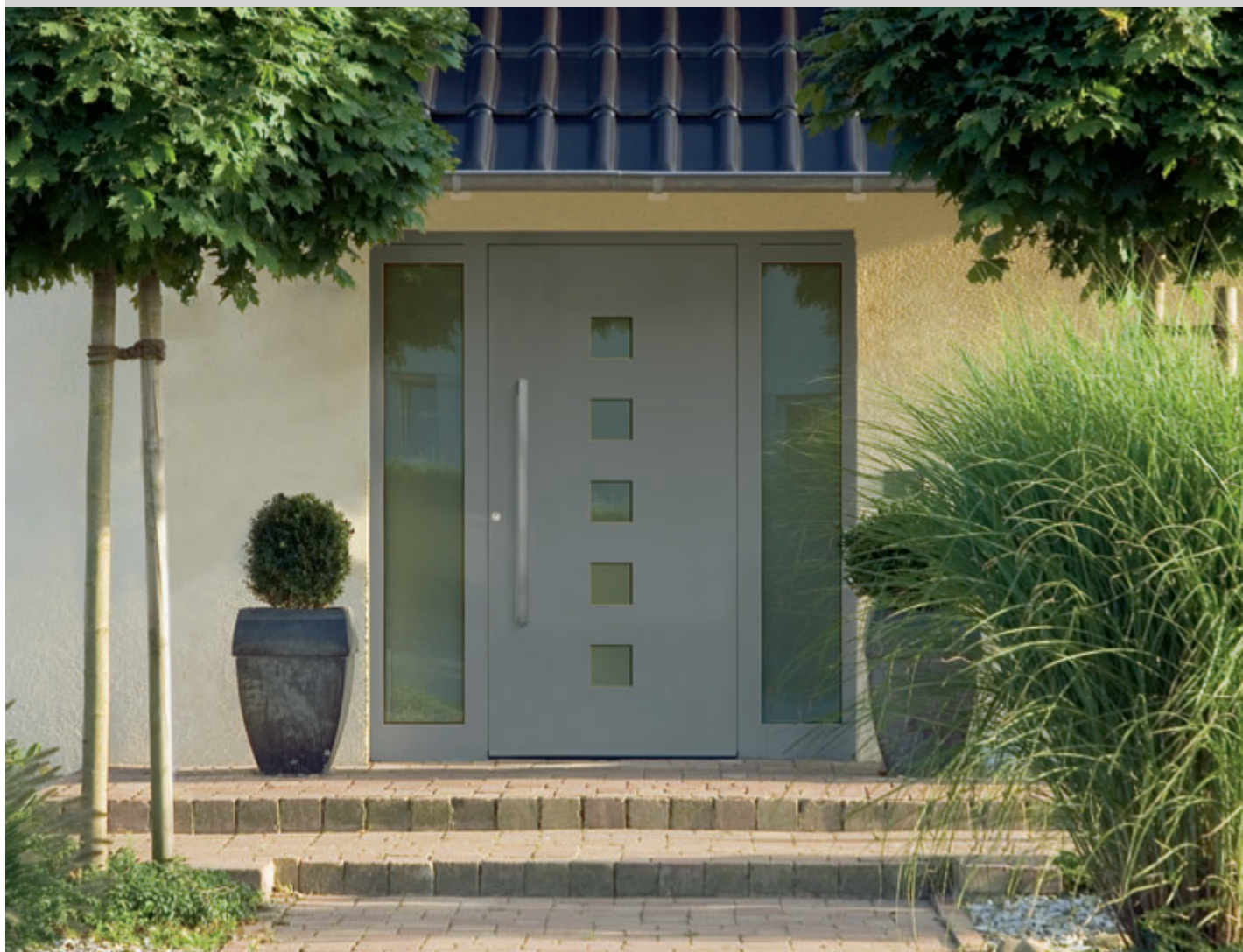
Model HA GTB 60 Griffgarnitur ZAE 753