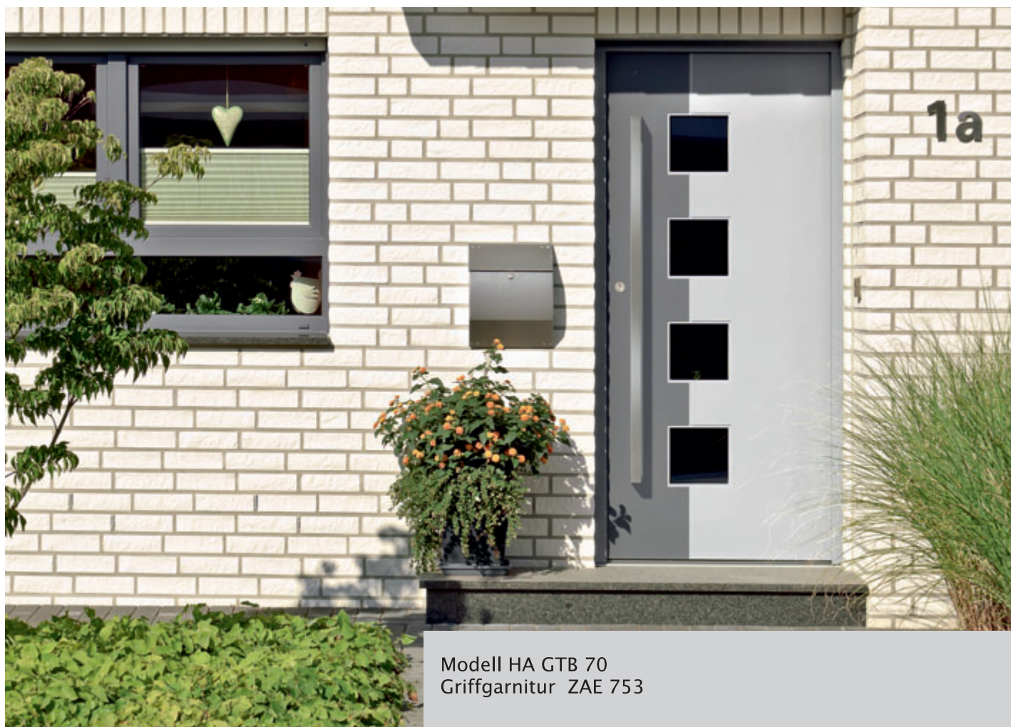
Modell HA GTB 70 Griffgarnitur ZAE 753